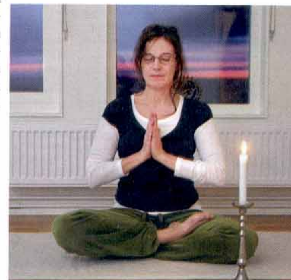
Carina mediterar regelbundet och leder också kurser i yoga.

– Eller att sitta här med dig nu och dricka te och känna den goda smaken. Och jag vet att ingenting är omöjligt. ■